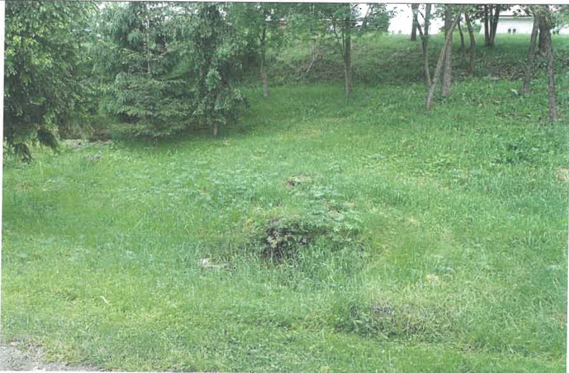
Widok na skarpe główną i podmokłości u podnóża