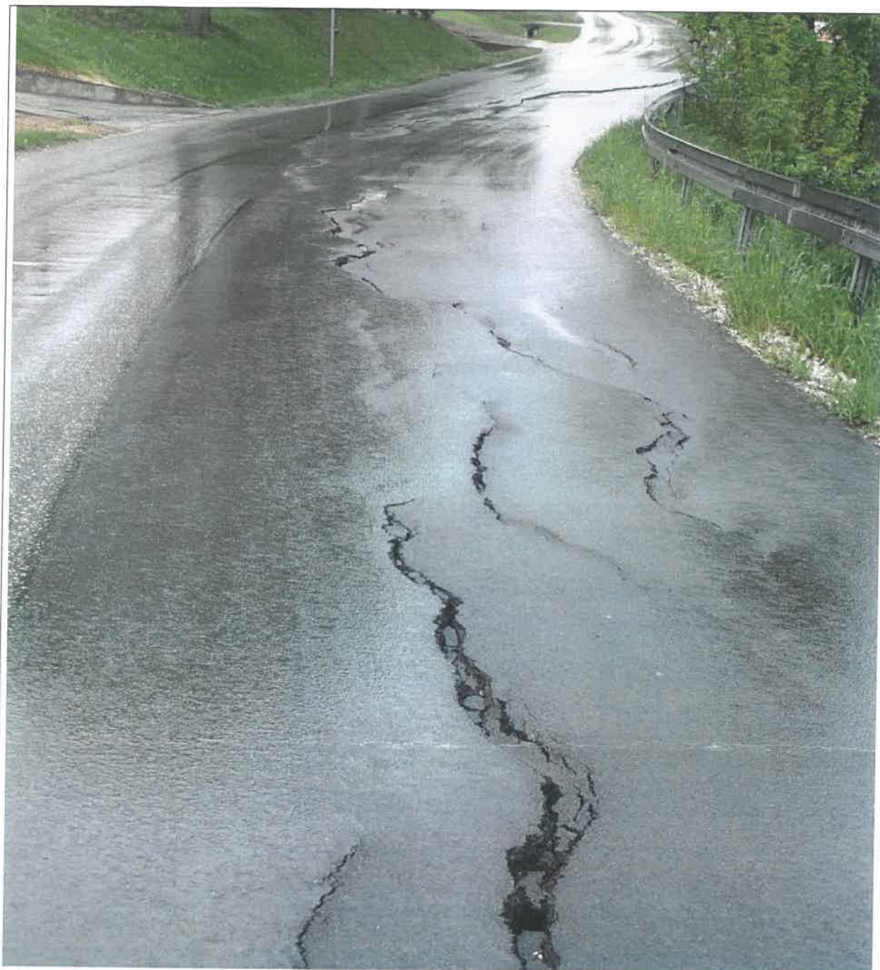
Widok na skarpe główną i niszczonej drodze powiatowej