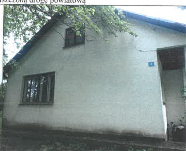
Zniszczony dom mieszkalny