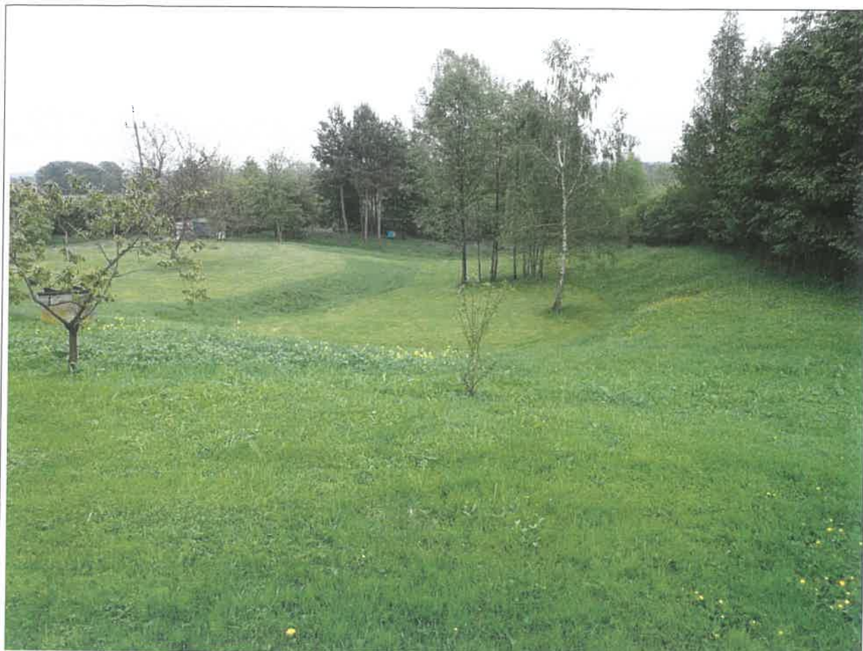
Widok na koluwia (jęzor osuwiskowy)