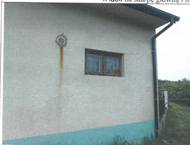
Spękany budynek gospodarczy