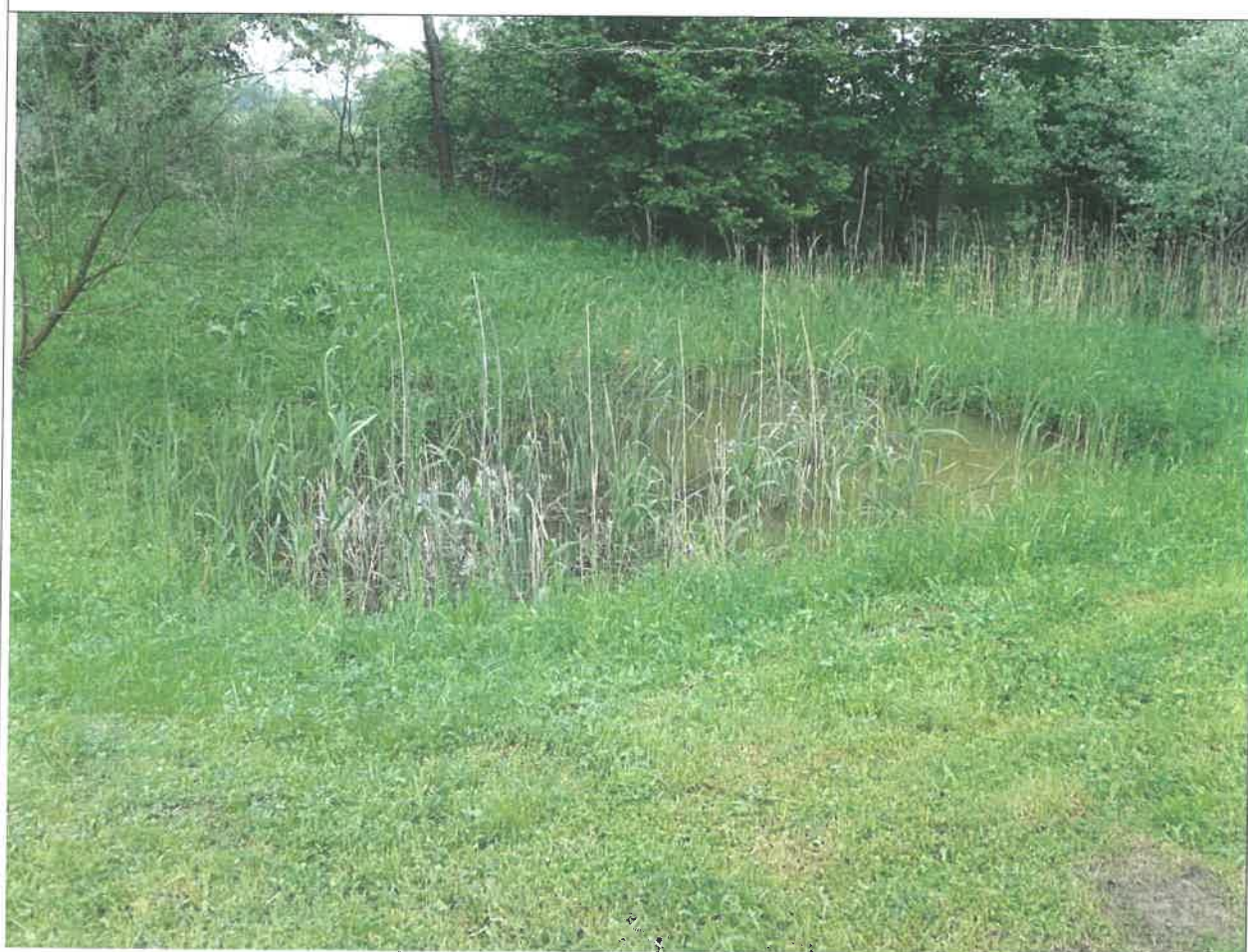
Jeziorko w dolnej części osuwiska